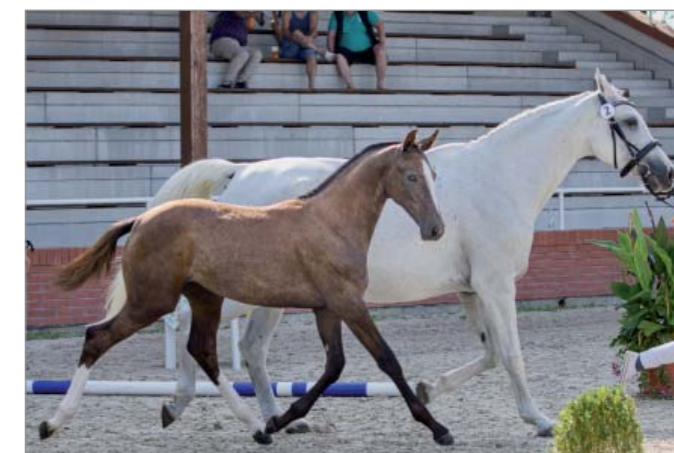
Agonie M. K. D.