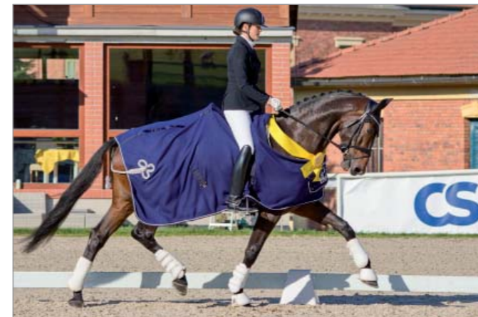
Prima Donna M