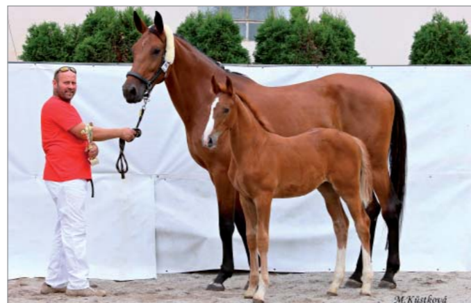
Mylord Ann Jumping