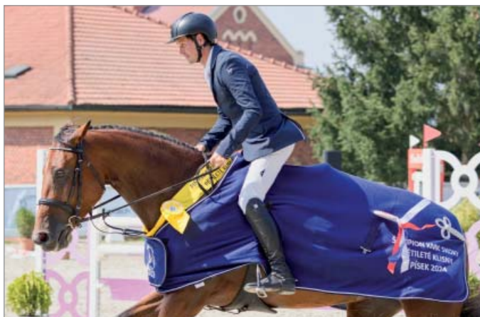
Lovely Lady LH

V každé kategorii se do finále může kvalifikovat dvacet nejúspěšnějších koní podle výsledků jednotlivých kvalifikačních soutěží. Finále je dvoukolové. V prvním kole finále startují koně v dané kategorii podle celkového bodového hodnocení dosaženého dle výše uvedené bodového klíče v kvalifikačních kolech, a to v pořadí od nejhodnějšího k nejlepšímu (tedy od koně, který postoupil s nejnižším počtem bodů z kvalifikačních kol, po koně postupujícího s nejvyšším počtem bodů z kvalifikačních kol). Ve druhém kole startují koně v obráceném pořadí prvního kola. Finále skokového KMK hodnotí minimálně tříčlenný sbor komisařů KMK, výsledná známka hodnoceného koně je průměrem dílčích známek všech komisařů. Pro rok 2024 obohatila tým zkušených komisařů KMK i zahraniční ikona Tjark Nagel z Německa.