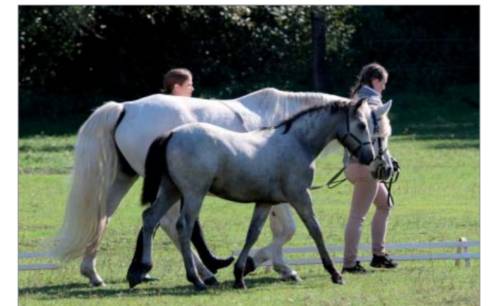
Diamondczech Moon Sky (Diamondczech Full Moon x Ardbear Mavis)