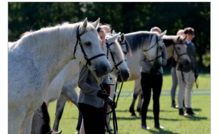
Třída connemara klisen