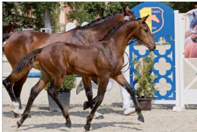
Glamour de Rossi