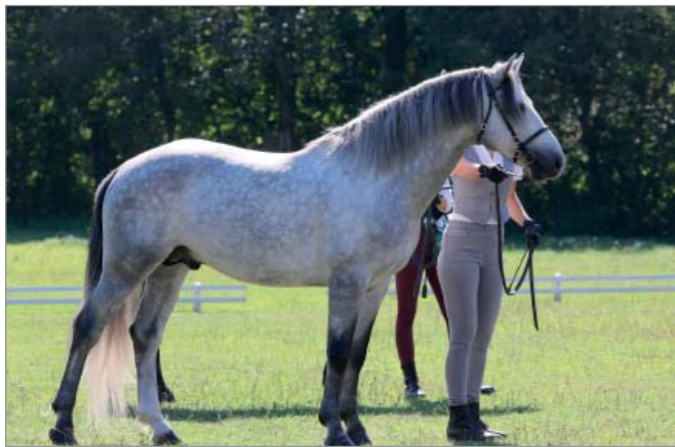
Diamondczech Full Moon (Diamant 424 x Kilpatrick Rose)