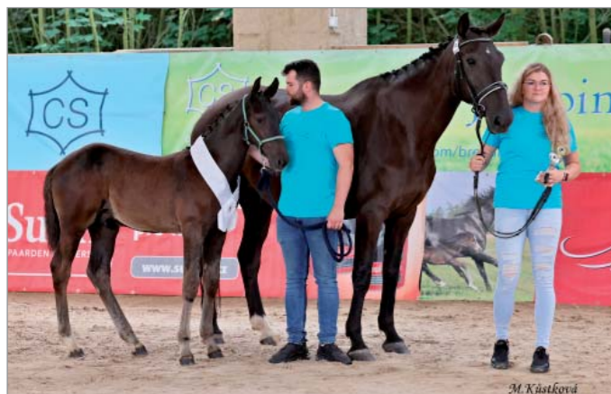
Dream of Dominator