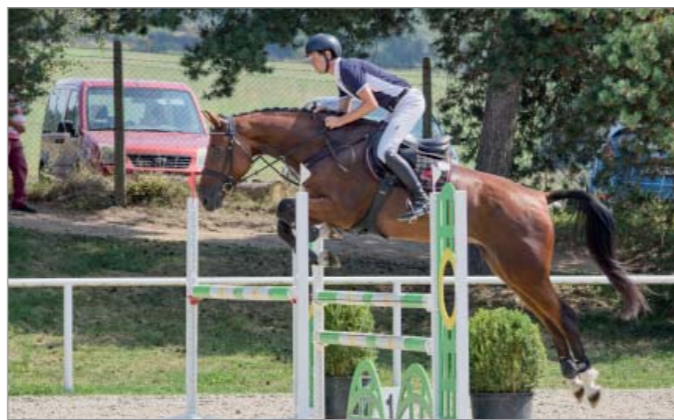
Lovely Lady LH