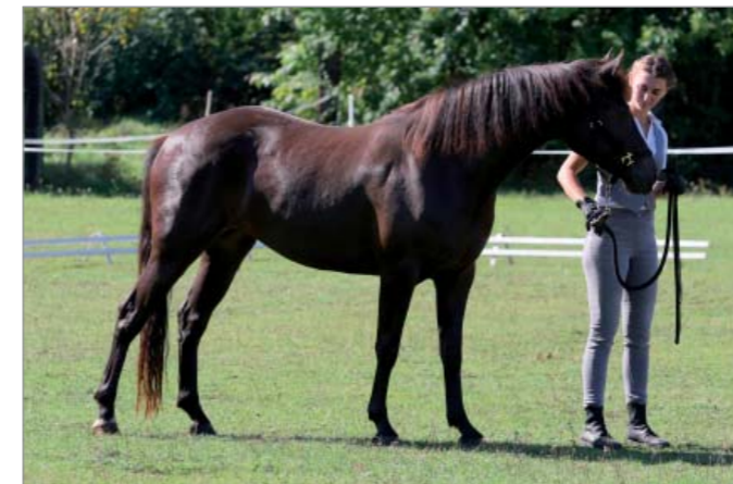
Diamondczech Caylee (Diamond's Cailin Connemara x Diamant 424)