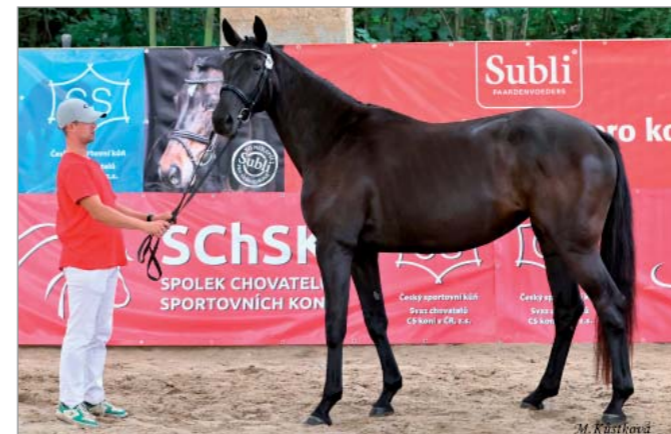
Dark Angel VH