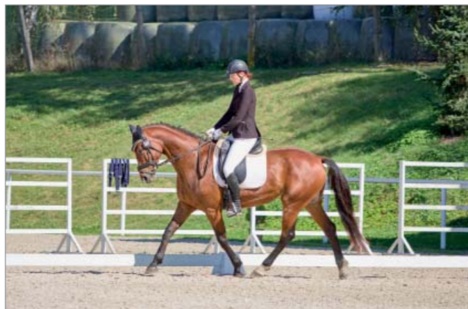
Catch My Shadow