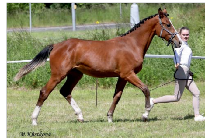
Sweet Salome 91/6