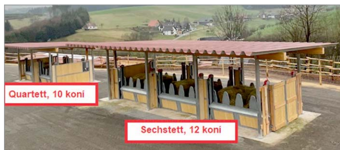
Quartett, 10 koní