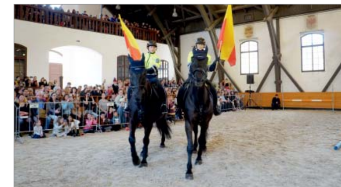
Ukázka výcviku koní Městské policie Praha 1