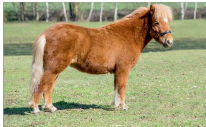
Freya of Kennbery