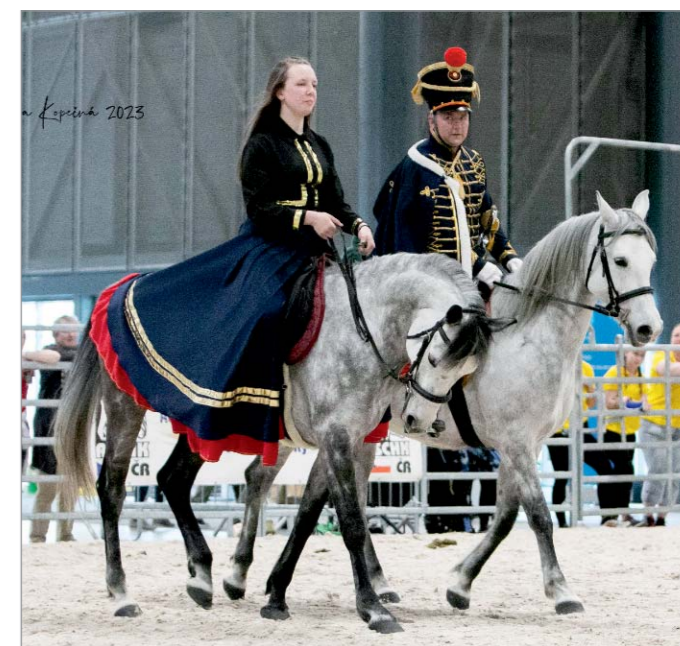
Jezdecká ukázka v historických kostýmech – klisna Nico a Siringa.