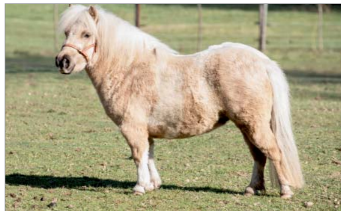
Chwispa Bella Rose