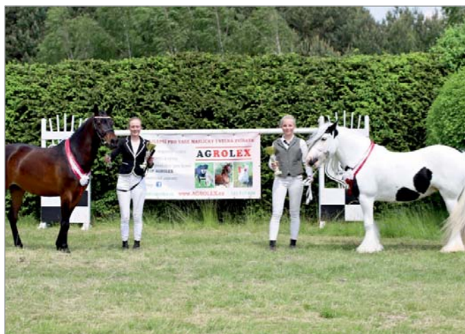
Supreme šampion SD Maeva a Supreme vícešampion Luna Zaval