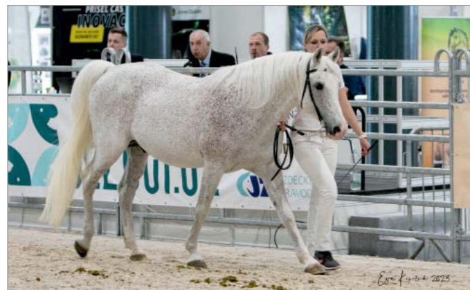
Plemenný hřebec Gazal II-CZ/Wizard při chovatelské přehlídce.