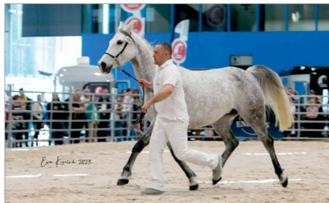
Plemenná klisna Siringa CZ-Sh-A-525 v klusu v rámci chovatelské přehlídky.

Plemeno Shagya arab bylo prezentováno dvakrát denně též v prostoru kruhové jízdárny pavilonu F. Zde byli zástupci tohoto plemene