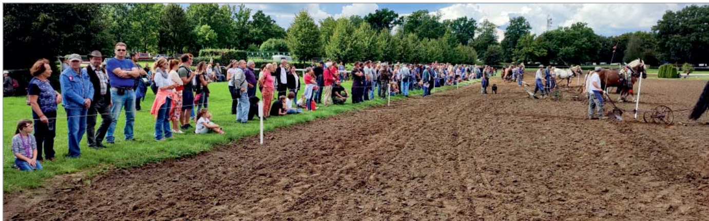
Start soutěže na oranici u Poplerova skoku

Pozn. Omlouvám se za nepřilíhající momentky ze soutěže, kterými doprovázím článek, jiné se mi nepodařilo zajistit.