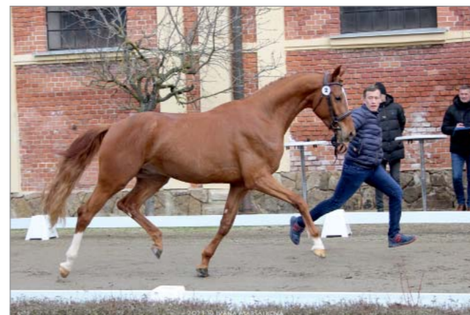
Zeylon (WESTF, Blue Hors Zackerey x Rivero III)