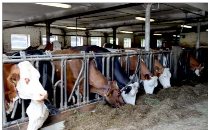
Švecovi se od roku 1991 věnují chovu mléčného skotu.