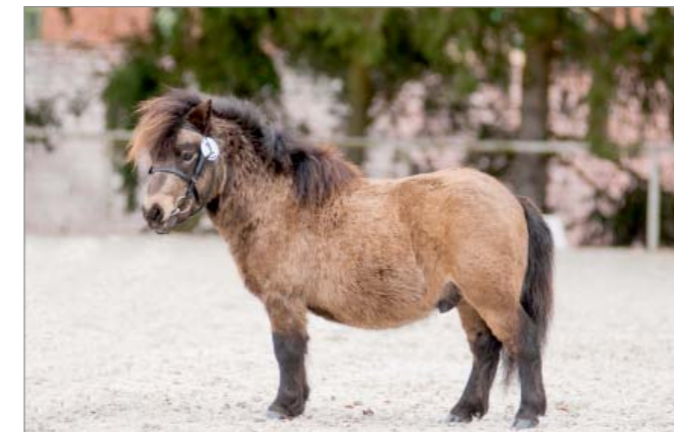
Alpinhorse Salazar Slytherin