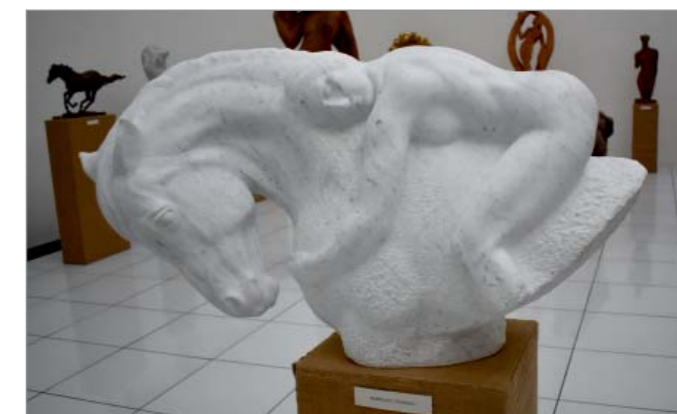
Kůň a akt