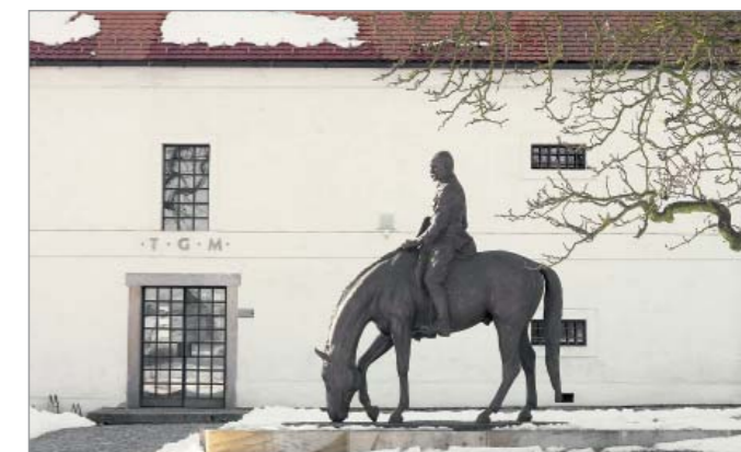
Jezdecká socha TGM před Muzeem v Lánech