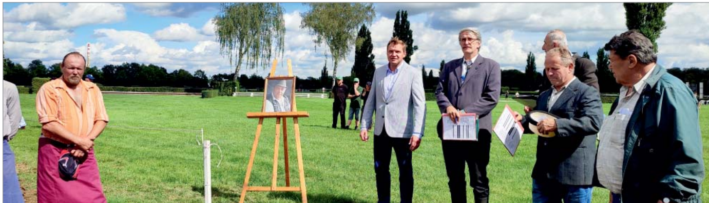
Zahájení soutěže ředitelem Dostihového spolku Pardubice spolu se sborem rozhodčích