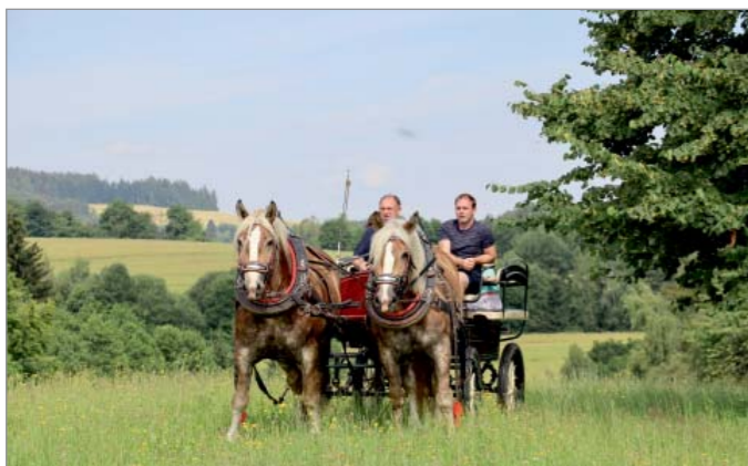
Chladnokrevní koně – norici jsou na statku chováni nepřetržitě již od roku 1953.