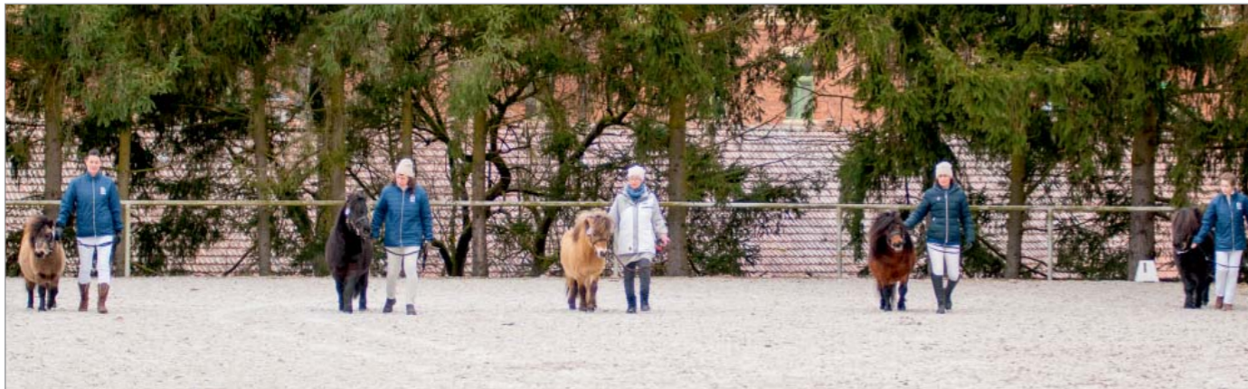
Licentace hřebců SHP Písek

Čtyři byli ročník 2020, tedy letos tříletí, a jeden starší, který absolvoval licentaci na druhý pokus. Všichni předvádění hřebci byli českého chovu. Komise posoudila každého hřebce nejprve v postoji a později posoudila pohyb. Hřebci měli možnost pohyb předvést ve volnosti na hale.