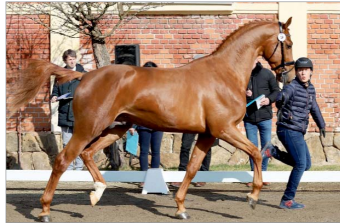
Poker Love P (KWPN, Poker de Mariposa x Krunch de Breve)

Importovaný belgický ryzák Ultra Boy M (Tangelo van Zuuthoeve x Andiamo) se ukázal jako dobrý sportovní kůň, avšak komise měla výhrady k typu i pohlavnímu výrazu. Bodové hodnocení za exteriér, za který hřebec získal 6,74 bodu, poznamenalo utváření hrudních končetin. Hřebec chyboval na výšce 130 cm, ukázal odrazovou sílu, dobrý cval, ale celkový dojem snížila horší technika skoku bez patřičného skokového luku.