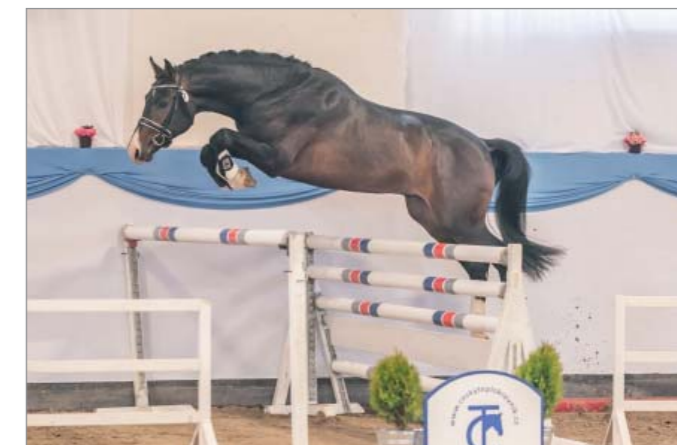
Dincarro (HOLST, Dinken x Carry)