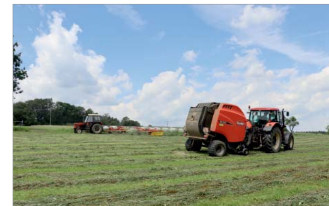
Rostlinná výroba je podřízena té živočišné, je třeba zajistit krmivo pro skot.