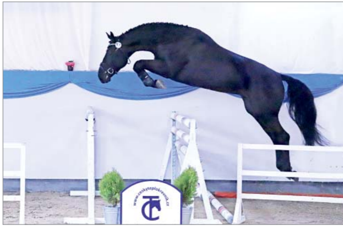
Ortega TN (HOLST, Origí d'O x Nabab de Reve)