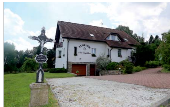
Vzhledem k bujícímu turismu v této oblasti se rodina rozhodla vystavět naproti statku penzion, který provozuje od roku 2006.