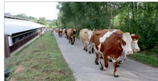
Pohled na dojnice, které se po ranním dojení na zlatou medaili oceněném Statku Kollertových (ASZ Náchodská) vydávají stejně jako každý den na pastvu, je už v naší krajině ojedinělý.

Šanci uspět a být do programu zařazeni mají nejen hospodáři, kteří aktivně ve svém okolí obnovují různé prvky, jež se za dlouhá desetiletí z krajiny často vytratily, jako jsou mokřady, remízky či aleje. Do programu se naopak mohou přihlásit i vcelku běžným způsobem hospodařící sedláci, kterým není lhostejný stav jejich pozemků a k ochraně prostředí přispívají i na první pohled méně viditelným způsobem, jako je pěstování méně častých druhů plodin, šetrné nakládání s půdou, dělení půdních bloků či obnova drobných sakrálních staveb. O všech těchto příkladech budeme velmi rádi informovat veřejnost, aby mohly posloužit jako inspirace nejen pro další sedláky, ale i pro ostatní obyvatele venkova. Novinkou od letošního roku je pro sedláky oceněné jak v minulých, tak i novém ročníku, možnost používat na své výrobky