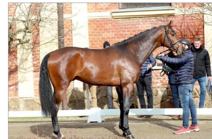
Conthargon (HOLST, Conthargos x Casall)